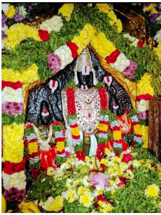
ప్రతిఘటన మహేశ్వరం రిపోర్టర్ ముత్తయ్య

శ్రీ ఆదిలక్ష్మి అలయాల మంగా సమేత వెంకటేశ్వర స్వామి క్షేత్రం 3700 ఏళ్ల నాటి చరిత్ర ఉన్న అత్యంత శక్తివంతమైన క్షేత్రంగా ప్రసిద్ధి చెందింది. కలియుగ దైవంగా భక్తుల కష్టాలు తీర్చే కొంగు బంగారంగా ప్రసిద్ధి. సాక్షాత్తు విష్ణువు అవతారమైన ఈయన, పాపాలను తొలగించే దేవుడు. వెంకటస్వామి దర్శించుకుంటే జన్మాంతర పాపాలు సరిపోయిన భక్తుల ప్రణాళి విశ్వాసం. రంగారెడ్డి జిల్లా, తుక్కుగూడ ఔటర్ రింగ్ రోడ్డు సమీపంలోని మంఖాల్ 67వ డివిజన్ శ్రీనగర్ (ఈ-సీటీ రోడ్) లో కొలువైన, బ్రహ్మాండ కోటి దేవ దేవుని శ్రీ ఆదిలక్ష్మి అలివేమలు మంగా సమేత శ్రీ బాలాజీ వెంకటేశ్వరస్వామి (స్వయంభూ) అలయం వార్షిక తిరు కల్యాణ మహోత్సవాలు నాలుగురోజుల పాటు వేడుకలు జరుగుతున్నాయి. సహజ సిద్ధమైన అలయం స్వయం భూ వెలిసిన అలయాల్లో శ్రీ వెంకటేశ్వరస్వామి అలయం ఒకటి. పూర్తిగా కొండల మధ్యనే ఉంటుంది. అలయ పరిసరాల్లో కోనేరు ఉంటుంది. ఎంత కరువు వచ్చినా అందులో నీరు ఎండిపోదు. కోనేటి నీరు తియ్యగా ఉంటాయి. స్వామివారికి నిర్వహించే తిరుకల్యాణంలో ఈ నీటితోనే అభిషేకాలు చేస్తారు. ఉత్సాహో భాగంగా ఈ నెల 28న సాయంత్రం 6.30కి ఎదురుకోలు . 7.30కి ఆదిలక్ష్మి అలివేలు మంగ, వేంకటేశ్వర స్వామి దంపతుల కల్యాణం నిర్వహిస్తారు. మహేశ్వరం నియోజకవర్గంతో పాటు జిల్లా నలుమూలల నుంచి వేల సంఖ్యలో భక్తులు వస్తారు. వేసవికాలం కావడంతో వచ్చే భక్తులకు ఎలాంటి ఇబ్బందులు రాకుండా అన్ని ఏర్పాట్లను పూర్తి చేసినట్లు అలయ ధర్మకర్త తెలిపారు. అలయ మాధ్యమం, పరిసర ప్రాంతాలను శుభ్రం చేశారు. భక్తులు స్వామివారిని దర్శించుకోవడానికి అన్ని ఏర్పాట్లు చేశారు.