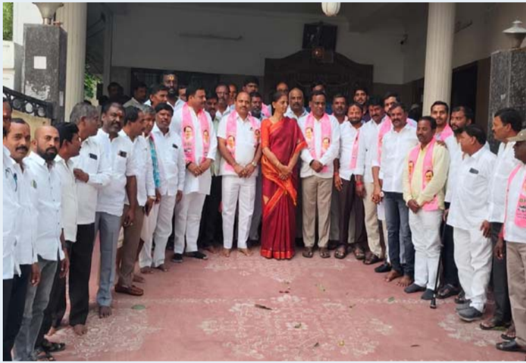
ప్రతిఘటన, మహేశ్వరం రిపోర్టర్ ముత్తయ్య

మహేశ్వరం మండల పరిధిలోని అమీర్ పేజీ గ్రామ బీజేపీకి భారీ షాక్